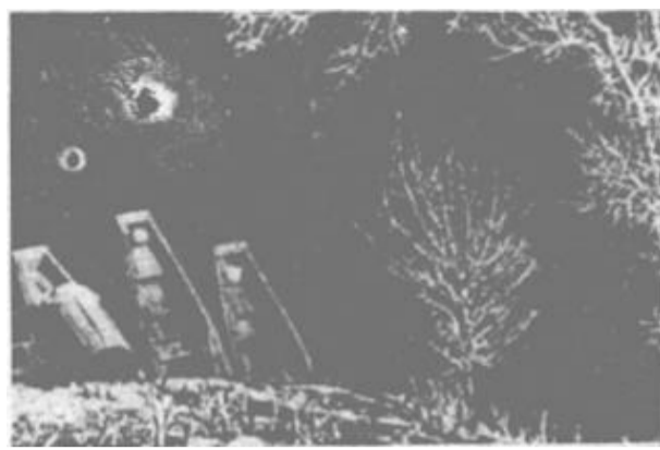
黄河岸边是家乡(右) 黄河口良宵美景(左)