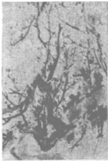
墨海 张丽林 画