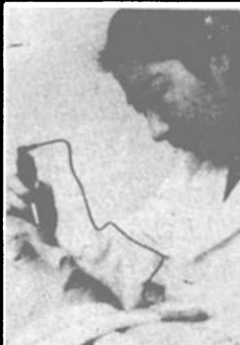
油城女儿俏丽美