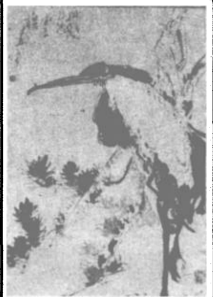
松鹤(上) 颜炳选 画 荷塘即景(下)